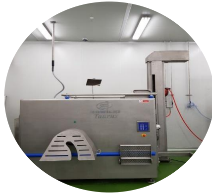
초파기 냉동육분쇄용 1대