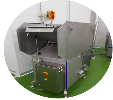
플레이커 냉동육절단 용 1대