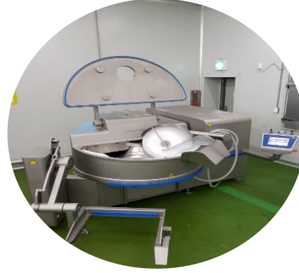
사일런트커터 식물성재료분쇄 용 1대