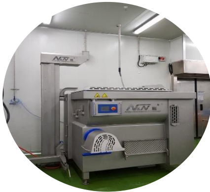
그라인더 믹서 분쇄육배합용 1대