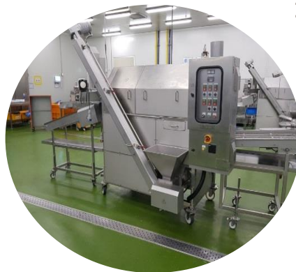
드럼파우더 분쇄육미분도포용 1대