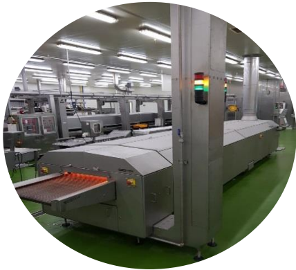
원적외선오븐 가공용 1대