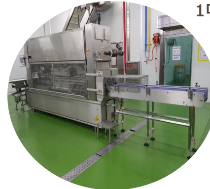
자동제함기 자동박스포장용 1대